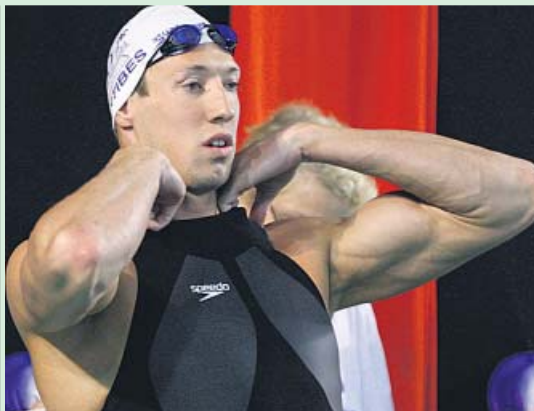
Bernard, el Nadal francés. El nadador francés lució unos espectaculares brazos en los nacionales de su país que firmaría el mismísimo Rafa Nadal.