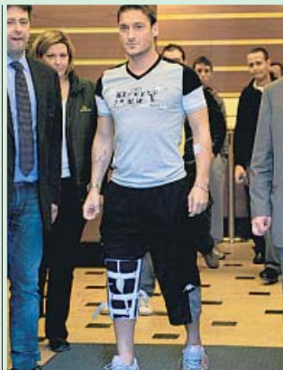
Deja la clínica. El jugador del Roma Totti fue dado de alta ayer tras ser operado de la rodilla.